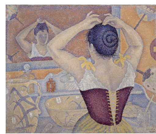
ポール・シニャック《髪を結う女、作品227》1892年 個人蔵 ©Droit Réserve

光と色のドラマ 新印象派 —モネ、スーラ、シニャックからマティスまで— 2014年 10/10(金)~ 2015年 1/12(月・祝) あべのハルカス美術館 お問い合わせ: TEL.06-4399-9050 〒545-6016 大阪市阿倍野区阿倍野筋1-1-43 http://www.aham.jp