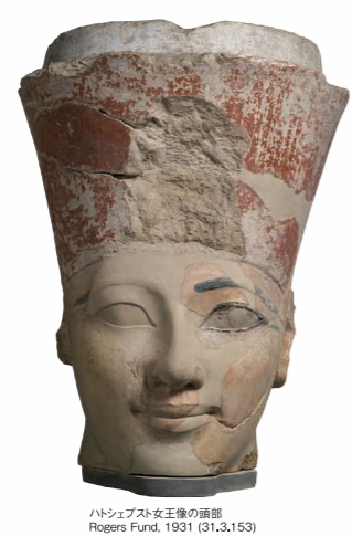
ハトシェプスト女王像の頭部 Rogers Fund, 1931 (31.3.153)

メトロポリタン美術館 古代エジプト展 —女王と女神— 2014年 10/13(月・祝)~ 2015年 1/12(月・祝) 神戸市立博物館 お問い合わせ: TEL.078-391-0035 〒650-0034 神戸市中央区京町24番地 http://met-egypt2014.jp