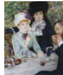
ピエール=オーギュスト=ルノワール(昼食後) 1879年 油彩・カンヴァス、100.5×81.3cm シュテットル美術館、フランクフルト