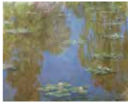
クロード・モネ(睡蓮)1903年 Musée Marmottan Monet, Paris